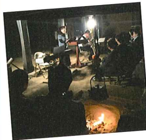
「二胡と朗読の会」(平田家にて)

昨年度は、小淵沢の平田家住宅で「二胡と朗読の会」を主催。また小淵沢図書館の「真夏の夜のおばけ話」や「クリスマスだ! パパ読んで」のおはなし会では、飾り付けやゲームを担当し、ワクワク・ドキドキ感を大幅にアップすることができました。小淵沢東・西保育園の団体貸出の選書や読み聞かせも、図書館と連携して行っています。