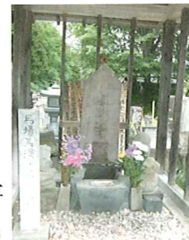
馬場 信房(信春)公墓

信玄の亡き後は勝頼に仕え、長篠の合戦では困難な敗軍のしんがりを務め、主君勝頼を無事退避させたのちに討死をとげた。遺言により、遺骨等は家臣の原四郎が持ち帰り、自元寺に埋められた。馬場美濃守信房(信春)の娘は、真田信尹(真田信繁の叔父)に嫁いでいる。