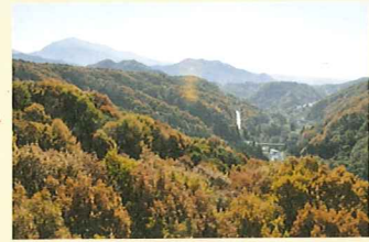
八ヶ岳高原大橋からの眺め

司書のつぶやき ほんまかいな! ～秋を探しにGO! 素敵な写真をGETだぜ!のまき～