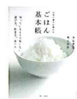
『お米の達人が教えるごはん基本帳』 西島豊造 飛田和緒 著 家の光協会

武川町は、国の天然記念物に指定され、樹齢2000年とも言われる「 実相寺神代桜 」をはじめとする 桜の名所 であることから「 桜 」に関する資料を収集しています。また、「 農林48号 」でも有名な、美味しい 武川米 の産地としても知られていることから「 米 」に関する資料も集めています。