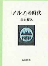
『「アルプ」の時代』 山口耀久 著 山と溪谷社

たかね図書館は、ハケ岳をはじめ南アルプス、富士山など四方の山々が見渡せる絶好のロケーションに建っています。その立地条件を活かし、「 山岳 」の資料を収集しています。それに関連して、高山植物・野生動物・野鳥・森林・樹木などの資料も集めています。毎年「 ハケ岳講座 」を開講し、資料の活用を図っています。