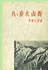
『ハケ岳火山群』 平賀文男 著 成光館書店

隣接している須玉ふれあい館（農村総合交流ターミナル）が農業振興の一端を担う拠点施設であることや、 農林業 が盛んな地域であることから「 農業 」に関する本の収集をしています。昨年度より「 農の学校 」と題して、年3回、講師をお招きして講座の開催もしており、農業に興味・関心のある方々より好評を得ています。雑誌『現代農業』も人気の一冊です。