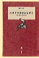
『ハチドリのはとすく』 辻伸一 監修 光文社