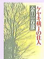
『ケヤキ横丁の住人』 金田一春彦 著 東京書籍

ハケ岳南麓の旧大泉村に山荘を建て、「第二のふるさと」としてこの地を愛した 金田一春彦先生 より、平成10年に2万6千点にも及ぶ書籍・写真・書簡、さらには貴重な自筆原稿をいただきました。 国語学者 である先生の資料が多数あることから「 ことば 」に関する本を収集しています。金田一先生が手に取り、目にされた「ことばたち」に会いにきてみませんか。