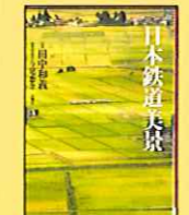
『日本鉄道美景』 田中和義 今尾恵介 著 新潮社刊