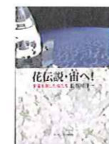
『花伝説・宙へ！』 長谷川洋一 著 ランダムハウス講談社