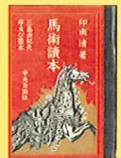
『馬術讀本』 印南清 著 中央公論社